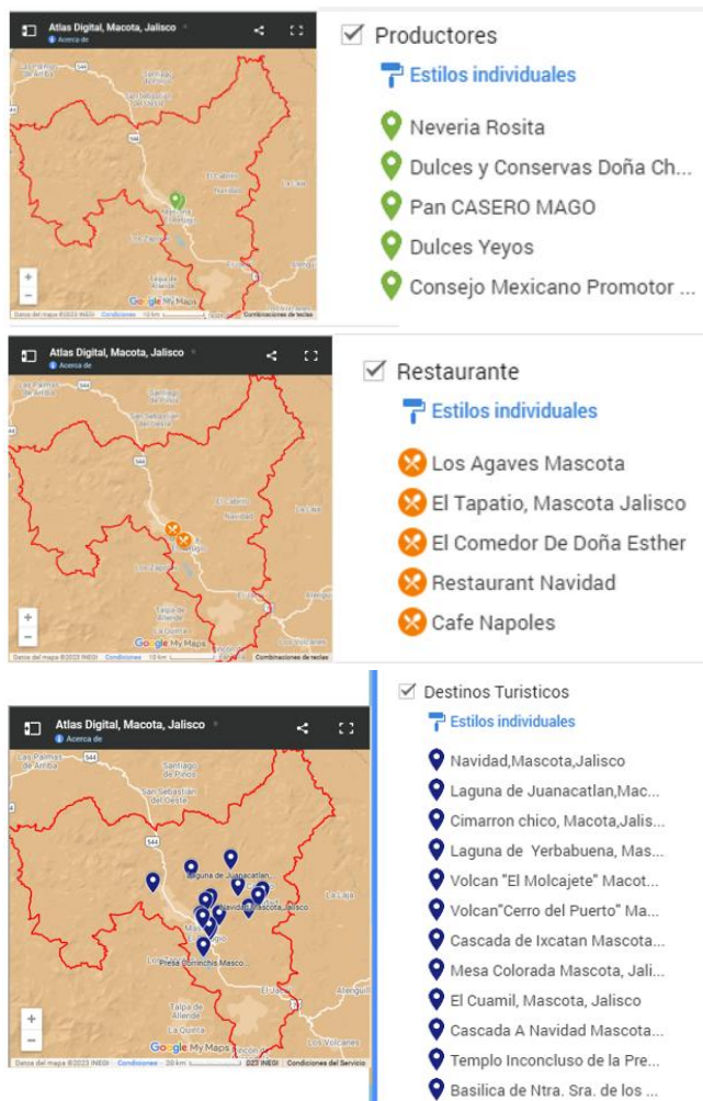
Fig. 2 Atlas digital con todas sus capas montado en el sitio oficial del H. Ayuntamiento de Mascota, Jalisco.

Este artículo muestra que la implementación de la cuádruple hélice en la realización de proyectos productivos municipales en México ha tenido resultados positivos. La colaboración entre los diferentes sectores ha permitido una mejor planeación, ejecución y evaluación de los proyectos, lo que ha contribuido a un mayor éxito en su implementación. Además, se identifican áreas de oportunidad en las que se puede seguir trabajando para fortalecer la colaboración entre los diferentes sectores y lograr un mayor impacto en el desarrollo económico y social del país.